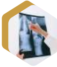
RADIOGRAFÍAS IMÁGENES DIAGNOSTICAS IONIZANTES