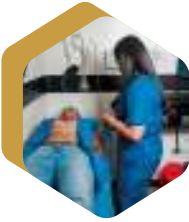
SALUD OCUPACIONAL Y MEDICINA GENERAL

En IPS VITAL EDM S.A.S., llevamos la excelencia en servicios de salud a un nuevo nivel. Desde salud ocupacional hasta imágenes diagnósticas, medicina general y especializada, laboratorio clínico, diagnóstico vascular, ecografía, terapias física y ocupacional, y medicina domiciliaria, ofrecemos un amplio espectro de atención respaldado por un equipo altamente capacitado. Tu bienestar es nuestra prioridad.